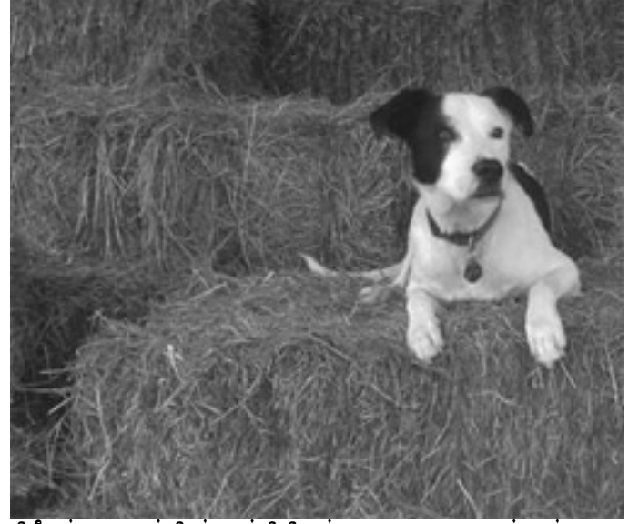
சிறீலங்கா சுதந்திரக் கட்சியிலுள்ள ஜனநாயக எண்ணம் கொண்டவர்களும் கோரி வருகின்றனர்.

மறுபக்கத்தில் இந்த 13ஆவது திருத்தச் சட்டத்தில் மாற்றங்கள் எதுவும் செய்யாமல், அதை அப்படியே அமுல்படுத்த வேண்டும் என, அரசாங்கத்தில் அங்கம் வகிக்கும் இடதுசாரிக் கட்சிகளும், தமிழ் - முஸ்லீம் மக்களைப் பிரதிநிதித்துவம் செய்யும் கட்சிகளும்,