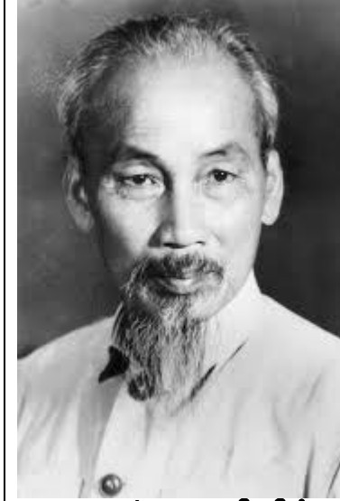
தோழர் ஹோ சி மின்

இலங்கை சுமார் 30 வருட காலமாக தனது நாட்டில் நிலவிய பயங்கரவாதத்திற்கும்,