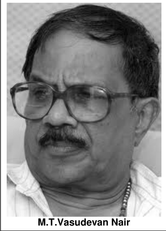
M.T. Vasudevan Nair

மலையாள நாவலாசிரியர்களில் எம்.டி.வாசுதேவன் நாயர் குறிப்பிடத்தக்க ஒருவர். அவர் எழுதிய நாவல்களில் 'நாலுகட்டு' என்ற நாவல் மிகப்பிரபலமானது. சாகித்திய அக்டமி பரிசு பெற்ற அந்த நாவல் ஒரு நிலப்பிரபுத்துவக் குடும்பத்தின் சிதைவை மிகவும் எளிமையாகவும், அதேவேளையில் அழகாகவும் சித்தரிக்கிறது. இந்த நாவல் 28 பதிப்புகளைக் கண்டு சுமார் 3 இலட்சம் பிரதிகள் விற்பனையாகி வருகிறது! தற்பொழுது தமிழிலும் 'கவிதா பப்ளிக்கேசன்' வெளியீடாக வந்துள்ளது.