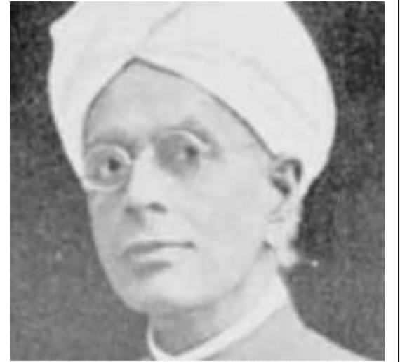
Sir Ponnambalam Ramanathan

எனவே அவர் “சுய உதவி” என்ற ஸ்மைல் எழுதிய நூலினையும், “ஒழுக்க விஞ்ஞானம்” என்னும் பிணைமிக்கின் நூலினையும் சுதேச