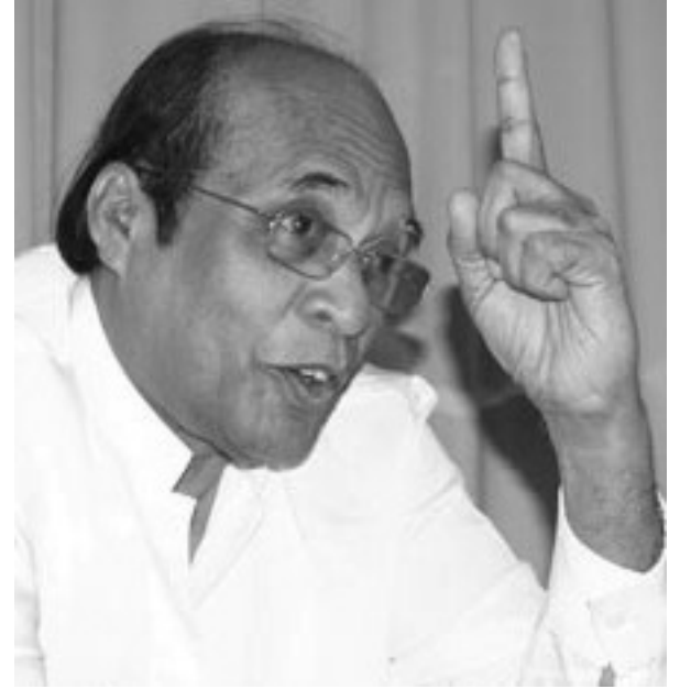
அமைச்சர் டியூ குணசேகர