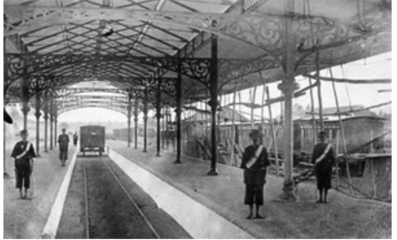
பிரித்தானிய காலத்து கொழும்பு புகையிரத நிலையம் (1860 - 1880)

முன்னொருபோதும் இல்லாத அளவுக்கு என்று வர்ண்ப்பதற்கு பொருத்தமான காரணிகள் இருப்பதால், தற்பொழுது ஏற்பட்டுள்ள நிலைமை மிகப் பாரதூரமானது என்றே சொல்லலாம். இலங்கையின் 2500 வருட வரலாற்றில் முன்னரும் பல தேசிய அபாயங்களும் நெருக்கடிகளும் ஏற்பட்டு வந்ததும்,