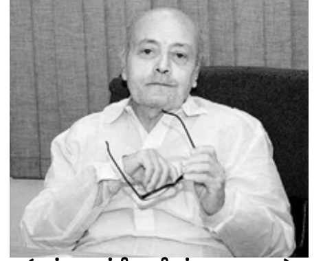
(எஸ்.பாலசுப்பிரமணியன். 1935 – 2014)

50 ஆண்டுகளுக்கும் மேலாக பத்திரிகைத்துறையில் ஆளுமை செலுத்திய ஒருவர். ஒரு கேலிச் சித்திரத்துக்காக எம்.ஜி.ஆரின் தமிழக அரசால் தண்டிக்கப்பட்டு மன்னிப்புக் கேட்க மறுத்து சிறை சென்று இறுதியில் தமிழக அரசைப் பணிய வைத்தவர்.