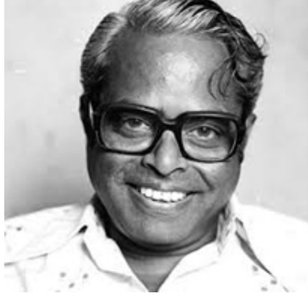
(கே.பாலச்சந்தர் 1930 – 2014)

கதைகளிலும், இராசா ராணிக் கதைகளிலும், ஜமின்தார் கதைகளிலும் மூழ்கியிருந்த தமிழ் சினிமாவை மத்தியதர மக்களின் பிரச்சினைகளைச் சொல்லும் ஊடகமாக மாற்றியதில் பாலச்சந்தர் பெருவெற்றி கண்டார்.