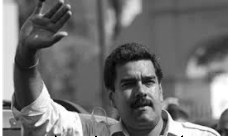
நிக்கோலஸ் மதுரோ மோரோஸ்

தென் அமெரிக்க நாடான வெனிசூலாவில் பொலிவோரிய புரட்சியை (Bolivarian Revolution) நடாத்தி, அந்த நாட்டை முற்போக்குப் பாதையில் வழிநடாத்திய மக்கள் அபிமானம் பெற்ற புரட்சித் தலைவர் ஜனாதிபதி ஹியூகோ சாவேஸ் புற்று நோயால் காலமானதைத் தொடர்ந்து, அந்த நாட்டில் 2013 ஏப்ரல் 14ஆம் திகதி நடைபெற்ற ஜனாதிபதித் தேர்தலில், அந்நாட்டு சோசலிஸ்ட் கட்சியின் புதிய தலைவர் நிக்கோலஸ் மதுரோ மோரோஸ் (Nicholas Maduro Moros) வெற்றி பெற்றுள்ளார்.