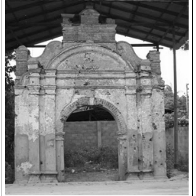
சங்கிலியன் அரண்மனை முகப்பு

அதற்கு முன்பே தமிழ் காங்கிரஸ் - தமிழரசுக் கட்சிகள் அந்தக் கைங்கரியத்தைத் தாராளமாகச் செய்து வந்துள்ளன. உதாரணமாக முஸ்லீம் மக்களைப் பார்த்து